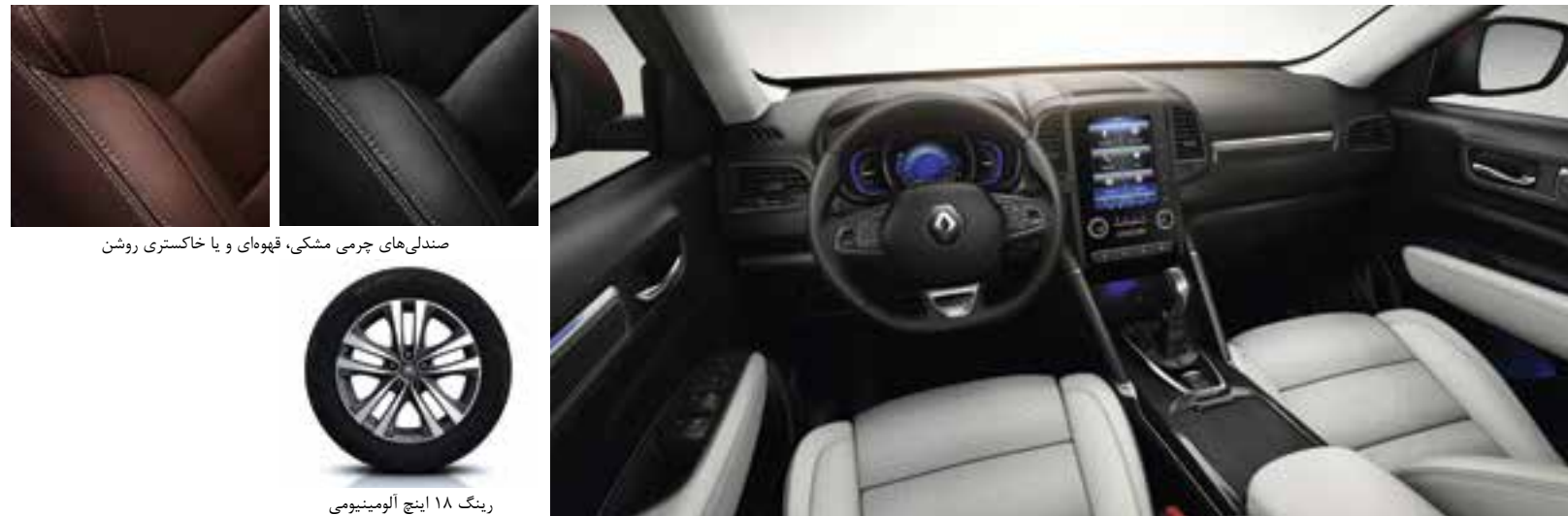
صندلی‌های چرمی مشکی، قهوه‌ای و یا خاکستری روشن