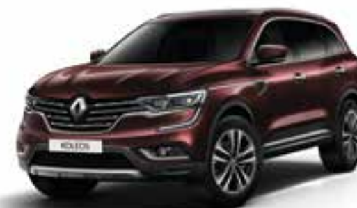
قهوه ای کپکشان‌ی