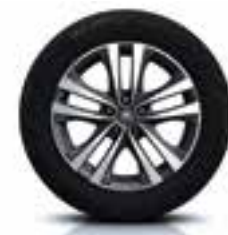
رینگ ۱۸ اینچ آلومینیومی