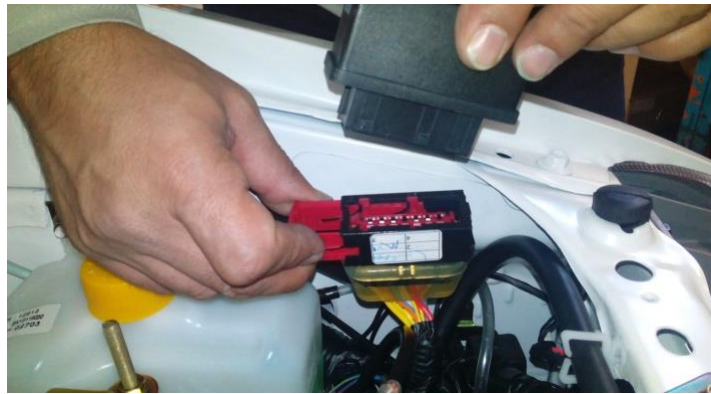
رله اصلی ایران پژوهش