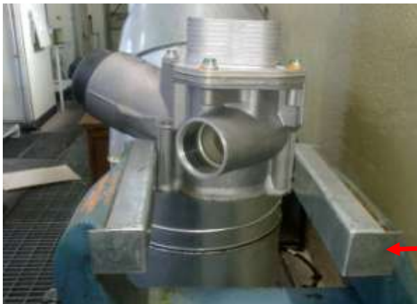
تصویر ۱- استفاده از گیره لبه دار به نحوی که به قطعه آسیبی نرسد

۳ - به منظور دمونتاز و مونتاز قطعه کولر روغن از اویل ماژول باید قطعه داخل گیره مهار گردد. با توجه به حساسیت قطعه اویل ماژول و بدنه آلومینیومی همچنین سطوح آبدی، لازم است از گیره با محافظ لبه تفلنی یا فلزی استفاده گردد. همچنین قطعه باید مطابق تصاویر ۱ و ۲ در گیره مهار تا از آسیب رسیدن به قطعه جلوگیری گردد. لازم به ذکر است با توجه به آلومینیومی بودن بدنه اویل ماژول از اعمال فشار بیش از حد به گیره پرهیز گردد.