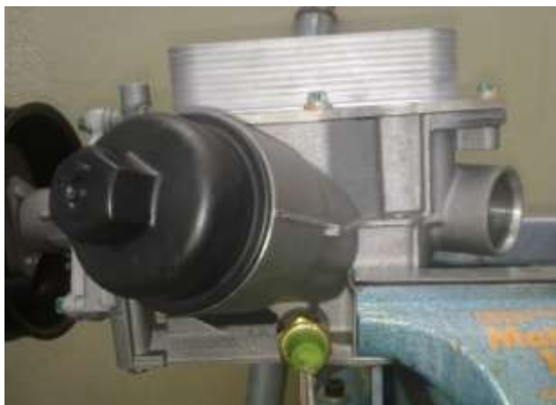
تصویر ۲- مهار قطعه در گیره به شکلی که به سنسور فشار آسیبی نرسد