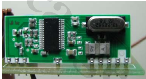
۳- نحوه تعمیر گیرنده رادیویی ریموت

در ابتدا به رفع متداولترین اشکال مدار گیرنده رادیویی ریموت می‌پردازیم. این مشکل اغلب در مواقعی رخ می‌دهد که برق مدار به دلیل اتصالی و یا نوسانات برق خودرو قطع شود. پس از تعویض فیوز مربوط به واحد قفل مرکزی در جعبه فیوز اصلی مشاهده می‌شود که ریموت کار نمی‌کند. همانگونه که در تصویر ۱ مشاهده می‌شود، بر روی مدار گیرنده رادیویی یک LED قرار دارد. ابتدا با جدا نمودن کانکتور برق مدار را قطع کنید. پس از چند ثانیه (برای تخلیه کامل خازن‌های الکترولیتی) برق را مجدداً وصل کنید. پس از زمان کوتاهی، LED باید به مدت یک ثانیه روشن و سپس خاموش شود. در این صورت می‌توان نتیجه گرفت که آی سی میکروکنترلر سالم است و برنامه‌ای که روی آن قرار دارد نیز به درستی اجرا می‌شود. یک روش دیگر برای تست کردن آی سی میکروکنترلر اینست که دکمه صندوق پران روی داشبورد را به مدت ۴ ثانیه نگه دارید. اگر درب صندوق باز شود به معنای سالم بودن میکروکنترلر است. زیرا فرمان قطع و وصل رله صندوق پران توسط میکروکنترلر صادر می‌شود.