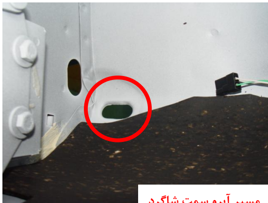
مسیر آبرو سمت شاگرد

۲-۱- مسیرهای آبرو جلو (سمت راننده و سمت شاگرد) کنترل گردد که عاری از ذرات خارجی بوده و مسدود نباشد.