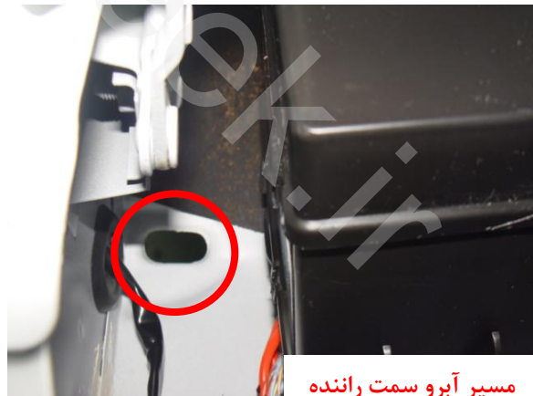
مسیر آبرو سمت راننده